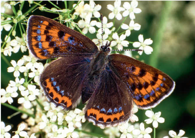
Abb. 1: Eiszeitrelikte wie der Blauschillernde Feuerfalter ( Lycaena helle ) zählen zu den Klimaverlierern.